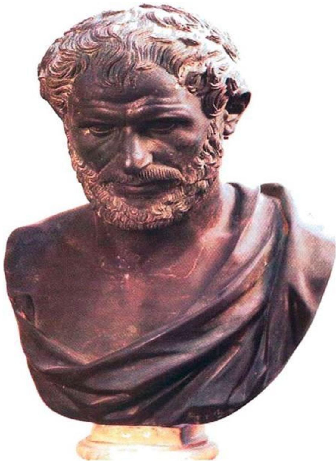
Προτομή του Αριστοτέλη (Νεάπολη, Εθνικό Μουσείο).